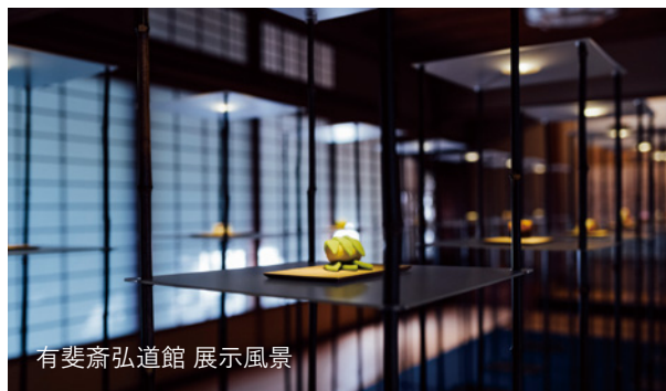
有斐斎弘道館 展示風景

2020年は「禅 ZEN」をテーマに京菓子デザインの公募を行いました。近年、世界からも注目を集めている禅。日本人の感性、美意識は禅から大きな影響を受けました。全国から約600点の応募があり、選ばれた入選作品50点を有斐斎弘道館及び旧三井家下鴨別邸、京都御苑、ジェイアール京都伊勢丹において展示いたしました。