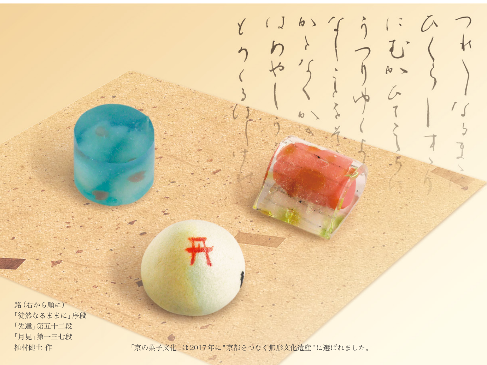
銘(右から順に) 「徒然なるままに」序段 「先達」第五十二段 「月見」第一三七段 植村健士 作